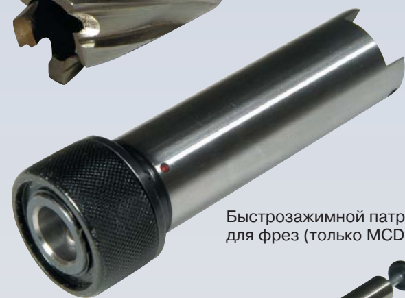
Быстрозажимной патрон для фрез (только MCD 36)