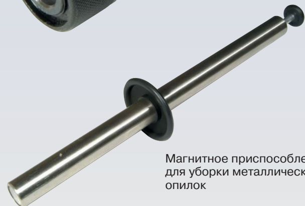
Магнитное приспособление для уборки металлических опилок